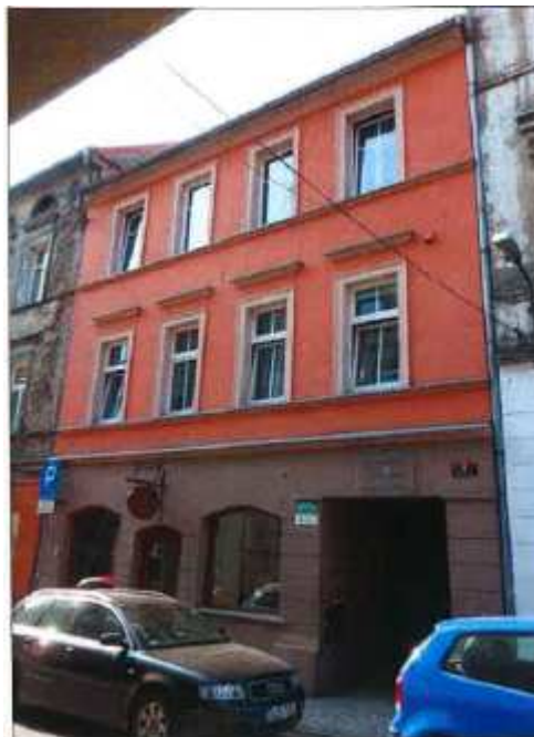
Widok elewacji frontowej – ul. Mikołaja nr 2.

na sprzedaż lokalu mieszkalnego Nr 4, znajdującego się w budynku położonym w Lubaniu przy ul. Mikołaja 2 wraz z udziałem we współwłasności nieruchomości gruntowej (działka nr 31, AM 3, Obręb III o powierzchni 198 m 2 , JG1L/00016272/2).